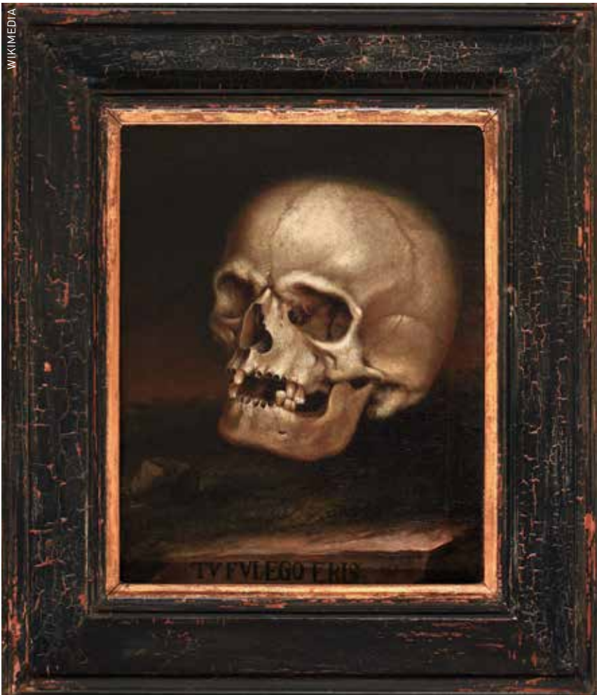
Tu fui, ego eris (ik was als jij, jij zult als mij zijn), geschilderd in de achttiende eeuw door Johann Georg Dieffenbrunner, verbeeldt ijdelheid en vergankelijkheid van het menselijk leven.

leven. Autonomie, zelf beslissen, de regie voeren, controle houden, dat zijn de woorden die steeds terugkomen. 'Ik wil dit niet', 'Zo ben ik niet', 'Dit leven zou vader nooit gewild hebben'.